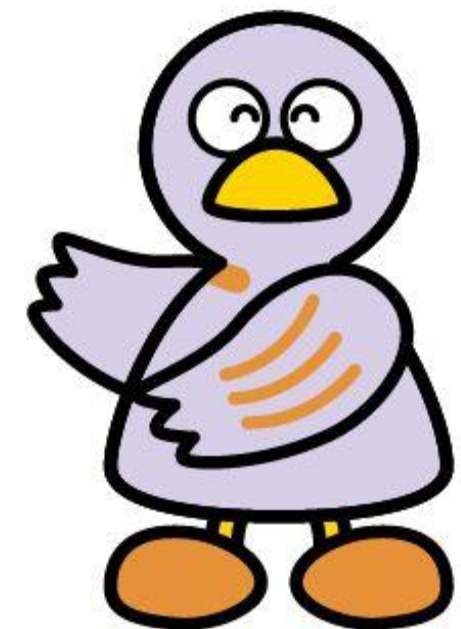
埼玉県のマスコット「コバトン」