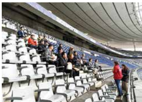
パリ スタッド・ド・フランスの視察風景