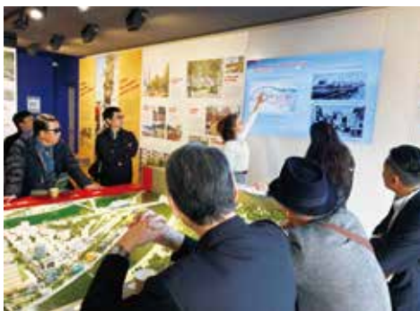
リヨンの視察風景