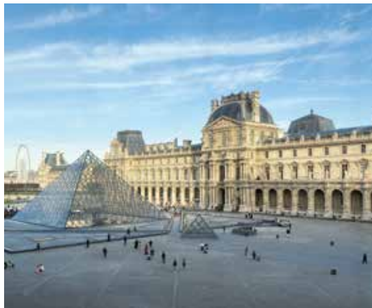
パリ ルーブル美術館の外観

国際的な大会が開催されるスタジアムのバックヤードまで見学したほか、歴史的建造物と近代的な建造物の共存等を実際に感じる事ができた有意義な研修となった。