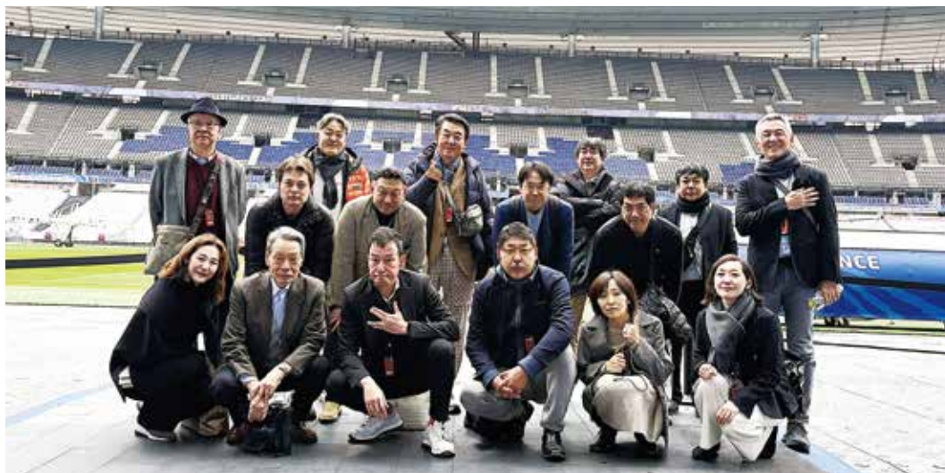
スタッド・ド・フランスでの集合写真