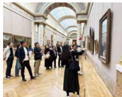
ルーブル美術館の視察風景