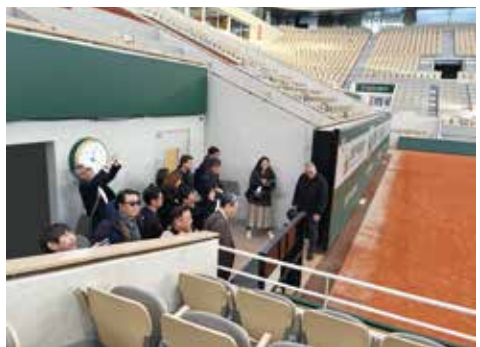
パリ ローラン・ギャロスの視察風景